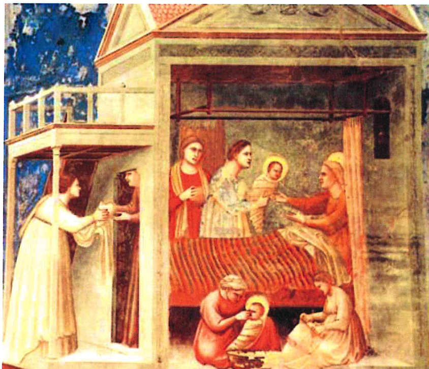
Giotto, Natività, Padova, Cappella degli Scrovegni

PARROCCHIA PREPOSITURALE di BRIVIO Santi Martiri SISINIO, MARTIRIO e ALESSANDRO